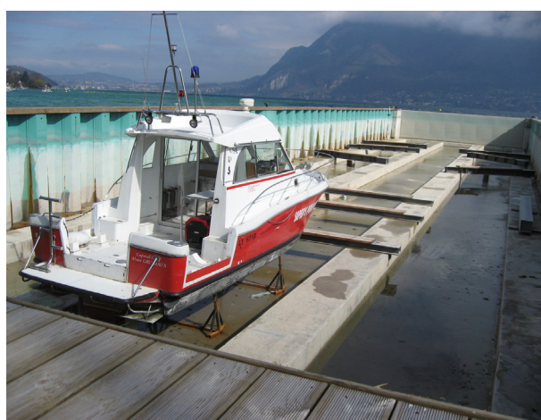
La cale-sèche à Sevrier