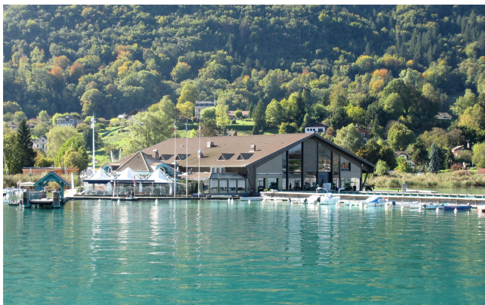
Le slipway depuis le lac - Gw.P. - SILA