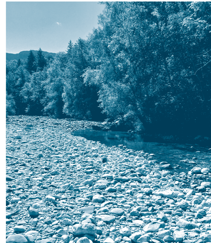
La Fillière en aval de Thorens-Glières, juillet 2023.

de maintenir un niveau d'eau dans les milieux, compatible avec leur fonctionnement naturel.